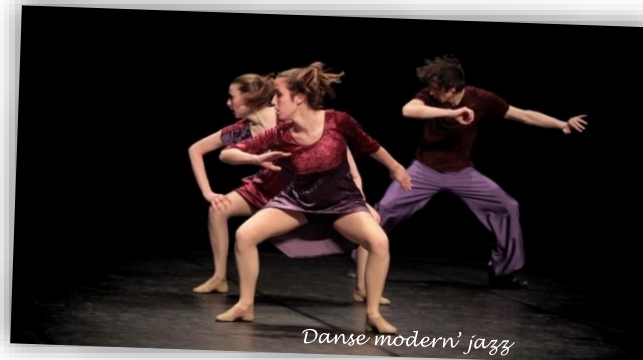
Danse modern' jazz