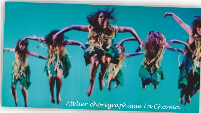
Atelier chorégraphique La Choréïa